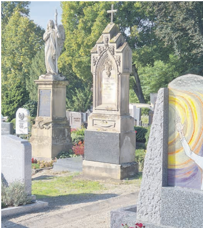
Harmonie von modernen und historischen Grabsteinen (Mitte: Familien Tretzel/1871 und Zemsch/1900).

Wussten Sie, dass es im Stadtgebiet von Sulzbach-Rosenberg über ein Dutzend Friedhöfe und Gruften gibt? Ältestes Beispiel ist das Adelsbegräbnis im oberen Schlosshof (ab 9. Jh.); zudem fand in der Burgkapelle 1499 ein Stadtprediger seine letzte Ruhe. Bei St. Marien legte man vor rund 1000 Jahren den ersten Stadtfriedhof an, mit eigener Kapelle. In deren Krypta wurde ebenso bestattet wie in der Pfarrkirche, unter der seit 1661 die Fürstengruft liegt. Der Boden der einstigen St. Barbara-Kapelle zu Siebeneichen nahm im 12.