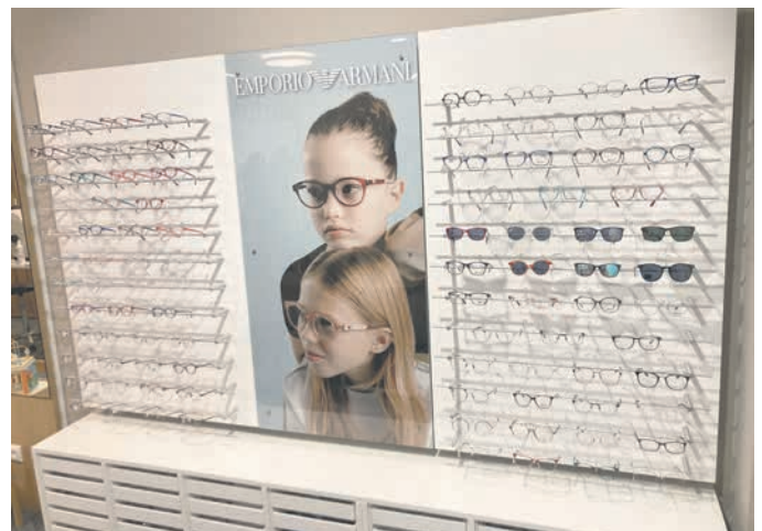
Moderne Kinderfassungen in großer Auswahl findet man bei Optik Klenck in der Fröschau.