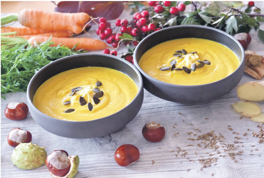
Wärmt von innen: Ayurvedische Karotten-Ingwer-Suppe.