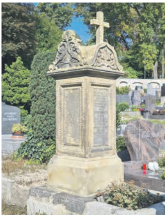
Klassizistisches Sandstein-Grabmal der Familie Meinel (1828) mit ausführlichen Inschriften.

als Aufsatz meist ein Kreuz (16 Stück), zwei eine abgebrochene Säule, je eines einen Obelisken bzw. eine Engelsfigur; zwei zierte eine Giebelbekrönung. Von den neun sonstigen Stelen sind zwei in Adikulaform (wie ein kleines Gehäuse), eine als Obelisk und eine mit Blendnische gestaltet, zwei krönt eine Giebel- und drei eine Walmdach-Konstruktion. Außerdem finden sich drei Grabmal-Wände; darunter nahe der Friedhofskirche die der Familie Schießel, die größte Ruhestätte überhaupt. Zwei Gräber um 1915 zeigen lebensgroße weibliche Figuren: bei Familie Sörgel aus Stein, bei Familie Mack aus Bronze.