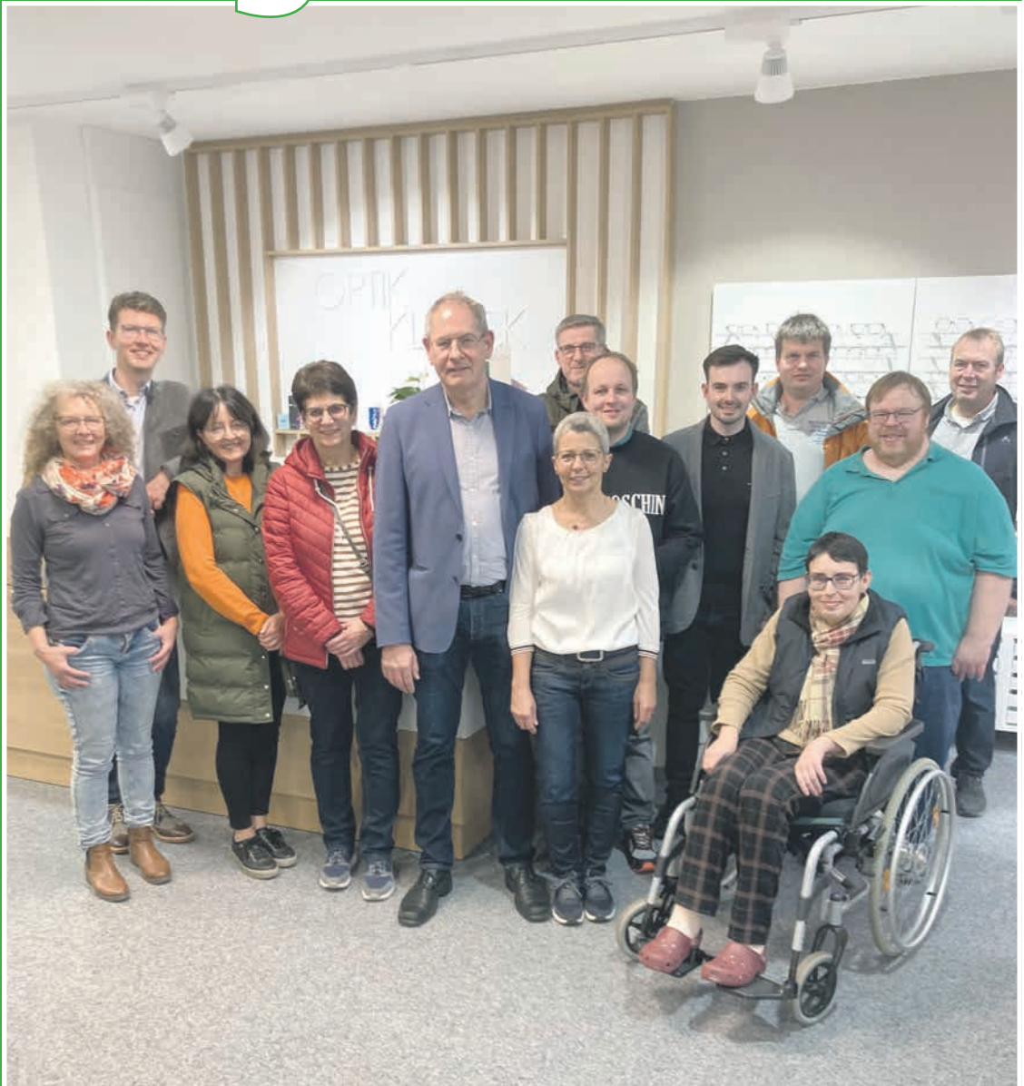
Pro Su-Ro in der neu renovierten Optik Kleck Filiale in der Fröschau

Ammerthal Birgland Edelsfeld Etzelwang Gebenbach Hahnbach Hirschbach Illschwang Königstein Neukirchen Poppenricht Sorghof Trasslberg Vilseck Weigendorf