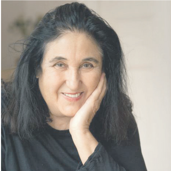
Emine Sevgi Özdamar

Lesung und Gespräch mit Bühner-Preisträgerin Emine Sevgi Özdamar