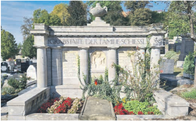
Die Schießel-Grabwand (um 1916) mit Christus Relief in der Mitte erinnert an viele Generationen der prominenten Familie.

als Aufsatz meist ein Kreuz (16 Stück), zwei eine abgebrochene Säule, je eines einen Obelisken bzw. eine Engelsfigur; zwei zierte eine Giebelbekrönung. Von den neun sonstigen Stelen sind zwei in Adikulaform (wie ein kleines Gehäuse), eine als Obelisk und eine mit Blendnische gestaltet, zwei krönt eine Giebel- und drei eine Walmdach-Konstruktion. Außerdem finden sich drei Grabmal-Wände; darunter nahe der Friedhofskirche die der Familie Schießel, die größte Ruhestätte überhaupt. Zwei Gräber um 1915 zeigen lebensgroße weibliche Figuren: bei Familie Sörgel aus Stein, bei Familie Mack aus Bronze.