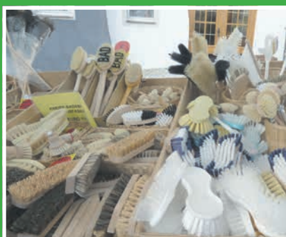
13. November: Martinimarkt