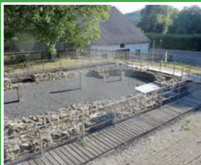
Radtour: St. Martin in Ermhof