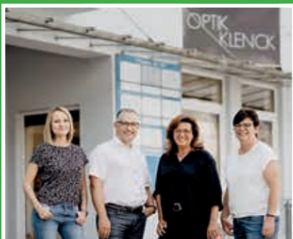
Team Optik Klenck/Fröschau