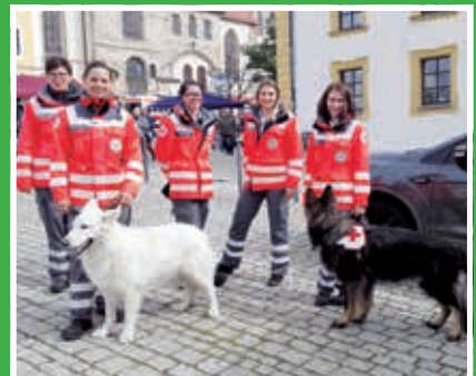
Besenfest: BRK Hundestaffel