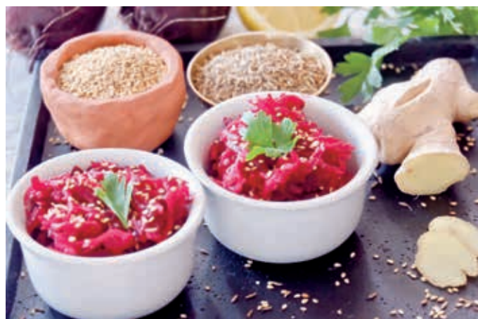
Heimisches Herbstgemüse ayurvedisch zubereitet.