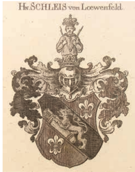
Das Wappen der Schleis von Löwenfeld enthält auch zwei Sulzbacher Lilien.