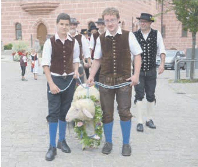
Nach 2-jähriger Corona-Pause heißt es heuer vom 20. bis 22. August wieder „Oh Kirwa lou niat nou“!

Die altüberlieferte Sulzbacher Woizkirwa beginnt am Samstagfrüh um 7.00 Uhr mit dem „Fällen und Holen“ des Kirwabau- baumes im städtischen „Hasel-