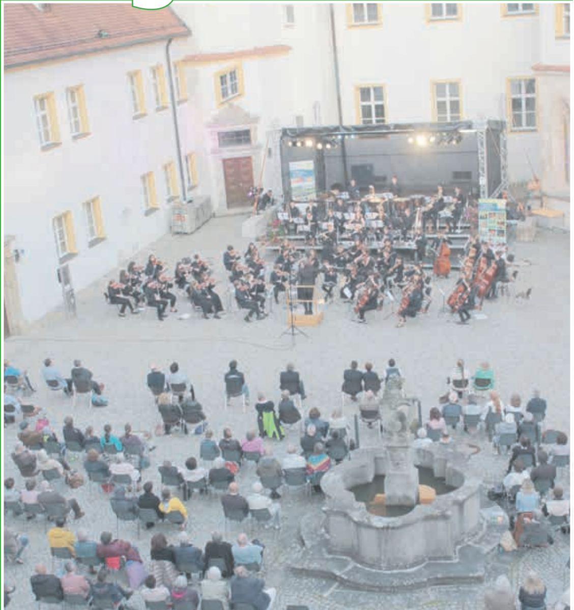
Klassik-open-air im Schlosshof Sulzbach-Rosenberg

Ammerthal Birgland Edelsfeld Eitzelwang Gebenbach Hahnbach Hirschbach Illschwang Königstein Neukirchen Poppenricht Sorghof Trasslberg Vilseck Weigendorf