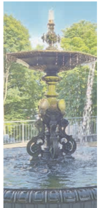
Den gusseisernen Springbrunnen am Sparkassenplatz hatte 1878 Fa. G. Kuhn (Stuttgart) für den Platz vor der Pfarrkirche gesponsert, als sie die städtische Wasserversorgung völlig neu errichtete.

70 m 3 Inhalt. Der neue, runde Wasserturm ragte mit seinen Zinnen am Kranzgesims markant über die Dächer des Bühlviertels. Zusätzlich zu 100 ersten privaten Hausanschlüssen bekam die Oberstadt acht neue Entnahme-Brunnen aus Gusseisen. Die steinernen Barockbrunnen mit Neptun und Delphinen verschwanden. Zudem spendierte Fa. Kuhn für den Platz vor der Pfarrkirche einen Springbrunnen, der seit 1993 vor der Sparkasse steht.