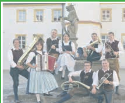
birg aaf, birg o´