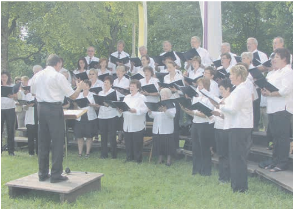
Der Gemischte Chor ist immer ein Ohrenschmauß