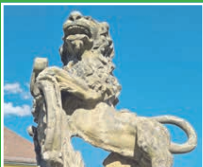
Die „Fürstliche Wasserkunst“