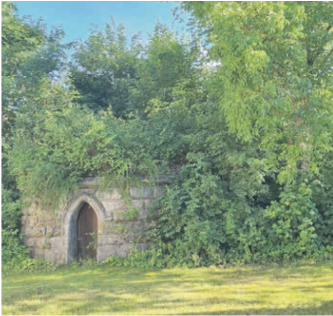
Vom einstigen Wasserturm auf dem Bühl sind nur noch Erd- und Untergeschoß erhalten, längst eingerahmt von wucherndem Grün.

Leitungsnetz aus Gussrohren geschuldet. Mitte der 1950er Jahre war abermals eine Reorganisation der kompletten Anlagen fällig. Dabei wurden unter anderem das Magazin am Annaberg und seine Hauptzuleitung neu gebaut, das Pumpwerk in der Weiherstraße und die Behälter auf dem Bühl dagegen stillgelegt.