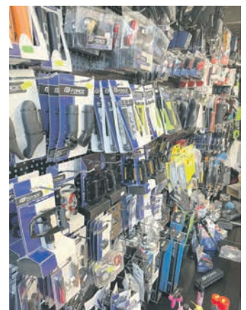
Auch Fahrrad-Zubehör findet man in großer Auswahl.