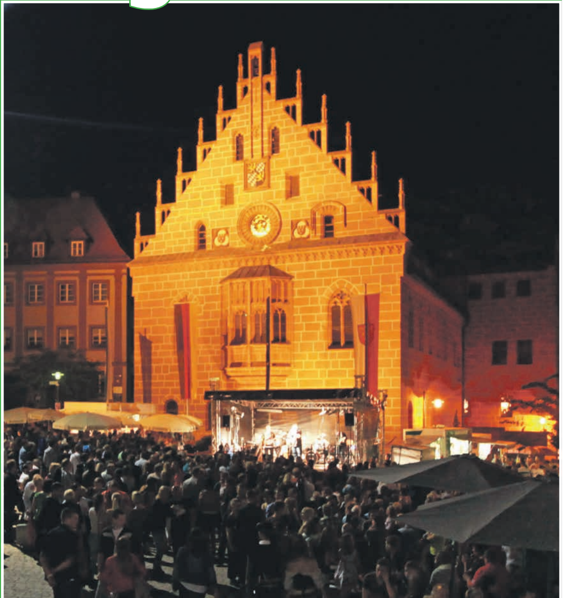
Altstadtfest in Sulzbach-Rosenberg

Ammerthal Birgland Edelsfeld Etzelwang Gebenbach Hahnbach Hirschbach Illschwang Königstein Neukirchen Poppenricht Sorghof Trasslberg Vilseck Weigendorf