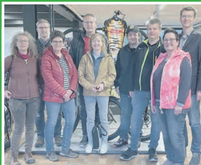
Pro Su-Ro bei Sportcycling Meindl