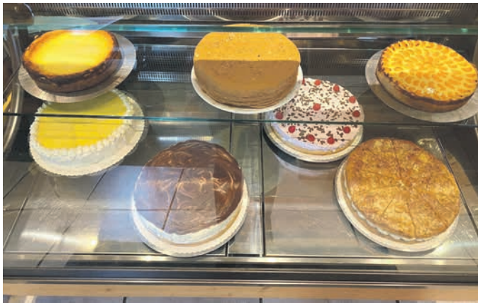
Alle unsere Torten und Kuchen sind selbstgebacken.

Das einzige Tagescafé im größten Stadtteil von Sulzbach-Rosenberg entstand 2003, als Ernst Schmidt am Ende der Knorr-von-Rosenroth-Straße das Gebäude errichtete, das noch heute seinen ursprünglichen geplanten Zweck erfüllt.