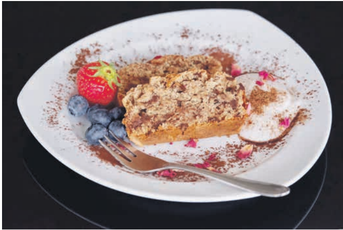
Bananenbrot in veganer Variante