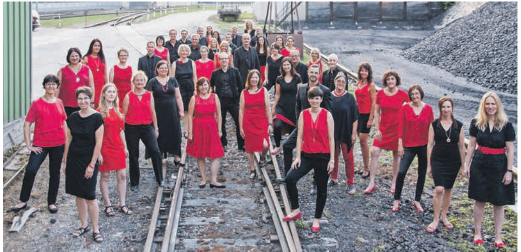
Die „Wolperdinger Singers“. Einlass zum Konzert ist ab 16.30 Uhr, Eintritt frei, freie Platzwahl.

So facettenreich wie das Fabeltier in seinem Namen, so vielseitig sind die musikalischen Stilrichtungen mit denen sich der Chor beschäftigt: Pop, Rock, Swing und Schlager versprechen einen unterhaltsamen Abend! Rockigem Sound folgen leise, stimmungsvolle Balladen – mit Ed Sheeran, John Lennon, Mark Foster, Queen und Udo Jürgens im Gepäck treffen die Sänger jeden Geschmack des Publikums.