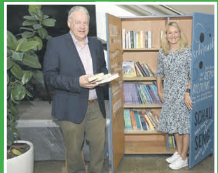
Bücherschrank im LCC