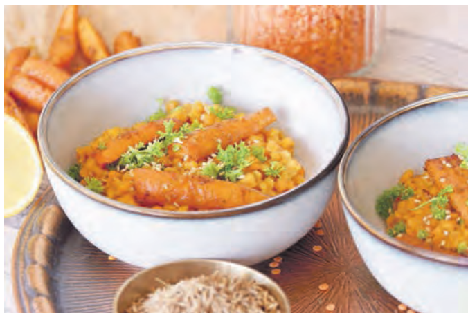
Als Beilage oder Hauptspeise: Lecker und gesund

Linsen sind in der ayurvedischen Küche unverzichtbar. Nicht nur weil sie Eisen, Magnesium und Zink, sondern auch 20 – 25 % Proteine enthalten. Ebenfalls kann sich ihr Aminosäureprofil sehen lassen. 6 der 8 lebenswichtigen Bausteine enthalten Linsen. Da rote Linsen bereits geschält sind, punktet dieser Salat auch durch die kurze Zubereitungszeit.