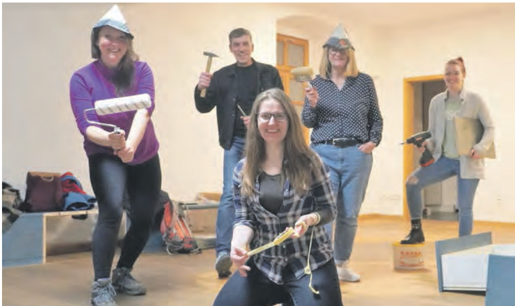
Die Buchhandlung Volkert freut sich auf den Umzug in die Rosenberger Straße 15.