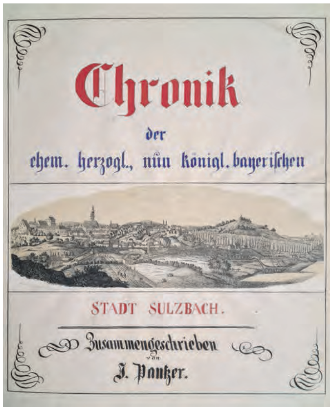
Johann Pantzers Stadtchronik von 1865 ist noch ungedruckt. (Original: Archiv J. E. v. Seidel, Foto: ml)

und Schreiben. Doch kam seinerzeit keine neue Stadtgeschichte heraus – auch nicht in den fünf Jahrzehnten nach dem II. Weltkrieg, obwohl sich ab der 950-Jahrfeier 1976 ganz viel neues Leben in der Orts-historiographie regte. Erst an der Schwelle zur Jahrtausend-wende wurde das lange Warten belohnt: Nach neunjähriger ‚Schwangerschaft‘ kam 1999 endlich die fast DIN-A4 große zweibändige Stadtgeschichte zur (literarischen) Welt. Die knapp 850 Seiten starke Nr. 12 der Schriftenreihe des Stadtmuseums und -archivs erschien in Kooperation mit dem Buch- & Kunst Verlag Oberpfalz. An die drei Dutzend Autoren haben daran mitgearbeitet. Ihr folgte 2006 die chronikähnliche, reich illustrierte Festschrift „350 Jahre Wittelsbacher Fürstentum Pfalz-Sulzbach“ als Band 22 selbiger Schriftenreihe.