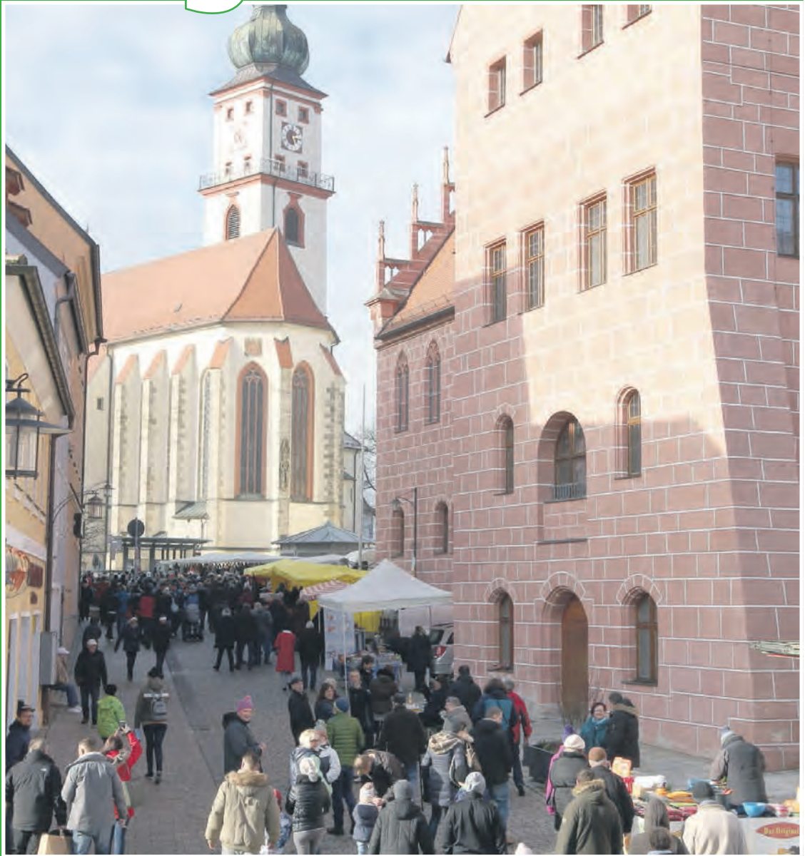
Am 16. April Marktsonntag in Sulzbach-Rosenberg